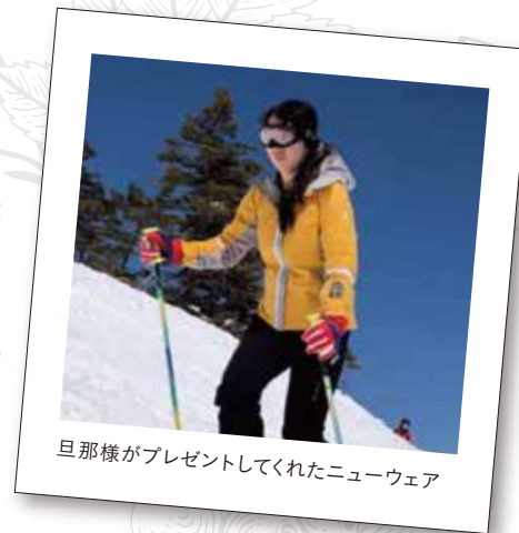
旦那様がプレゼントしてくれたニューウェア

念願のおしゃれなウェアを着られたこと。何より家族が喜んでくれたことが本当にうれしかったです。今度は新婚当時ぐらいにまで体型を戻そうと、続けてがんばっています! ピークレンズ+に出会えてよかったです。